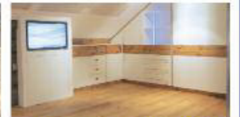
Innenausbau nach Maß

Für das Maison Relais in Grevenmacher hat die Firma THIEX aus D-Geichlingen den Innenausbau realisiert.